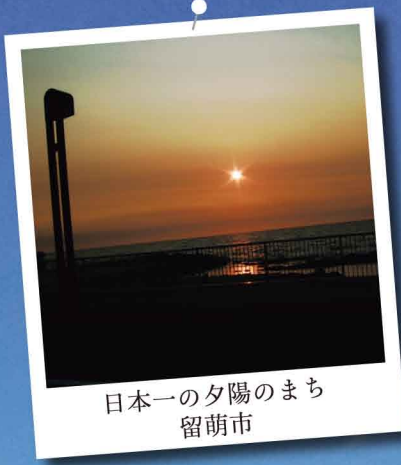
日本一の夕陽のまち 留萌市