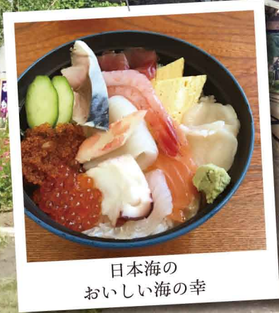
日本海の おいしい海の幸