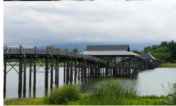
○写真左上: 津軽鉄道ストーブ列車 ○写真右上: りんご露天風呂 (ホテルアップルランド) ○写真左下: 鶴の舞橋 ※写真は全てイメージです。